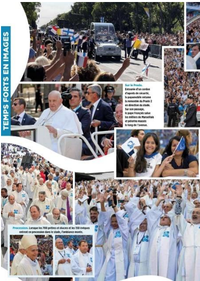
Sur le Prado. L'arrivée du cortège d'après-midi, la messe de 18h au palais du Prado 2 au quartier d'El Pardo. Sur son passage, le pape François a été salué par les milliers de Madridiens qui se sont rassemblés le long de l'avenue.